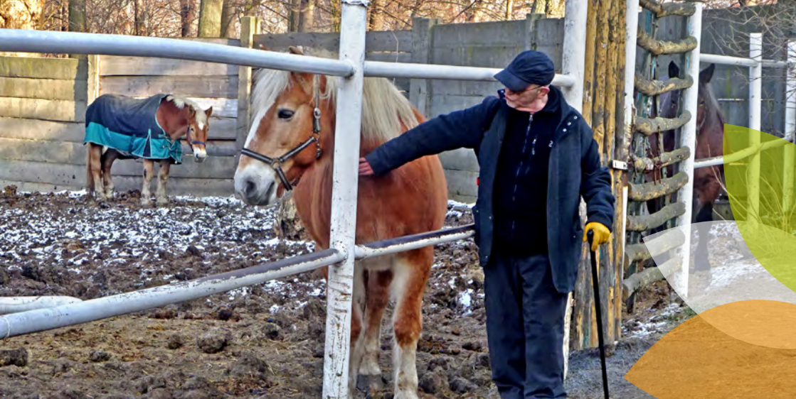
Socioterapeutická farma Bohnice