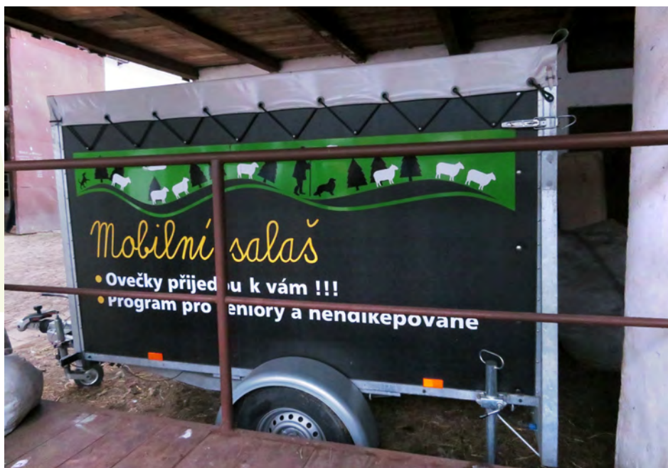
Venkovská škola Bludička

Více informací k workshopům je dostupných na http://eagri.cz/public/web/mze/venkov/ .