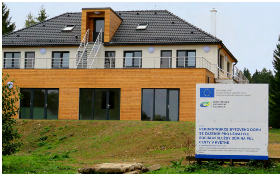
Květná zahrada, z.ú.

Rozvoj sociálního zemědělství v ČR II navazuje na předchozí a je realizovaný v letech 2018-2020. Účelem tohoto projektu je vytvořit podmínky a funkční prostředí pro realizaci konceptu sociálního zemědělství u pěti poskytovatelů sociálních služeb. Tento zemědělský přesah přinese do organizací inovované metody pracovní rehabilitace a terapie pro jejich uživatele. Přidruženými projektovými aktivitami je vytvoření reprezentativního videa o sociálním zemědělství a několik dalších propagačních materiálů.