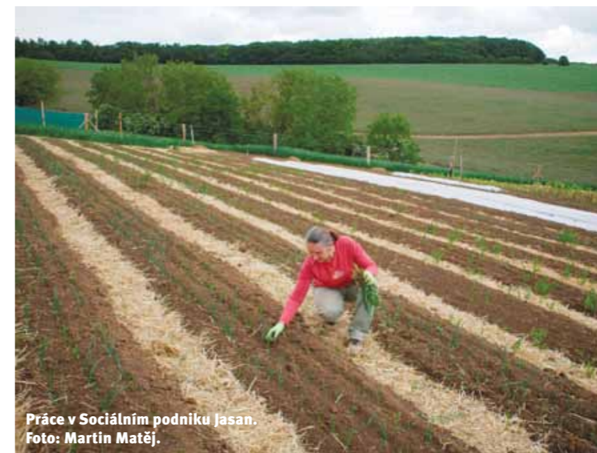
Práce v Sociálním podniku Jasan.