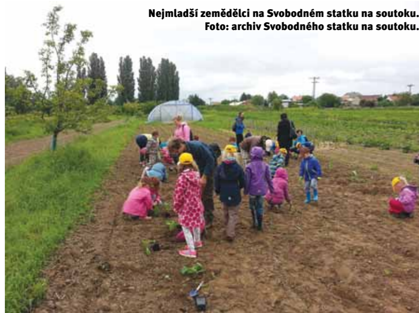
Nejmladší zemědělci na Svobodném statku na soutoku.

Sociální zemědělství je jednou z alternativních forem zemědělství, se kterými se v ČR setkáváme. Zatímco např. ekologické zemědělství se již vžilo a v tuzemském zemědělském prostředí patří mezi všeobecně známé formy hospodaření, sociální zemědělství se teprve začíná prosazovat.