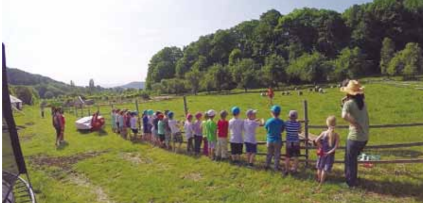
Farma Biostatek pro všechny generace.

péče o krajinu, zpracování rostlinné a živočišné výroby a prodej produktů. Variabilita zapojených farem a organizací je značná, obecně ale vytváří unikátní prostředí a přináší možnost uplatnění i osobám, které by svůj prostor jinde nacházely jen velmi obtížně.