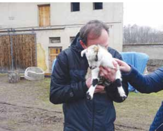
Kontakt se zvířaty jako nenahraditelná součást sociálního zemědělství na Koňském dvorci Chmelíštná.

Alternativní formy hospodaření často kladou zvýšený důraz na mimoprodukční funkce zemědělství a nejinak je tomu i v případě zemědělství sociálního, kde, jak už název napovídá, je do popředí stavěna právě funkce sociální. To neznamená, že by sociální zemědělství rezignovalo na funkci produkční, avšak