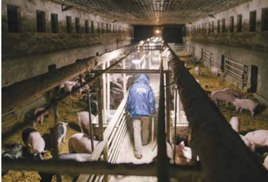
Krmení prasátek.

Elings a další zástupci nizozemské školy sociálního zemědělství. Podobně se vyjadřují i čeští sociální zemědělci. Léčivými prvky je nejen praktická práce, která je vidět a dává smysl od semínka až po políci ve spíži spotřebitele. Ale třeba i pohled na jehňata, pocit přínaléžitosti, který lidé se znevýhodněním často neznají, nové dovednosti, jež jim dodají sebedůvěru a pocit, že něco dokážou, jsou velmi důležité. Ceněné je neformální prostředí, zdravé jídlo, které se připravuje a konzumuje pohromadě, pokud k tomu má farma možnost. Farma je místo, kde se nehovoří ani tolik o tom, jak člověk selhal, ani o tom, že je nemocný a bezmocný, ani se nemusí cítit provinile kvůli rodině. Naopak se mluví o radostech, co koho těší či netěší, z čeho má strach, co mu/jí dělá radost a také, co je třeba udělat, aby na všechny neuhý svého života mohl/a na chvíli zapomenout. V tom je faremní prostředí jedinečné. Farma je nutně spojena