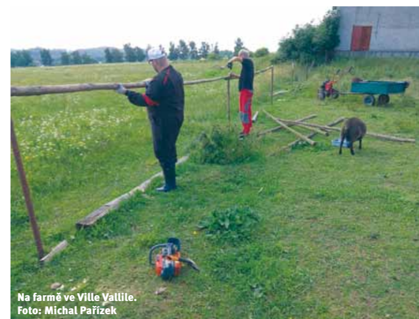
Na farmě ve Ville Vallile.

s půdou, s přírodou, pomáhá navracet se k lidským kořenům i cyklu života.