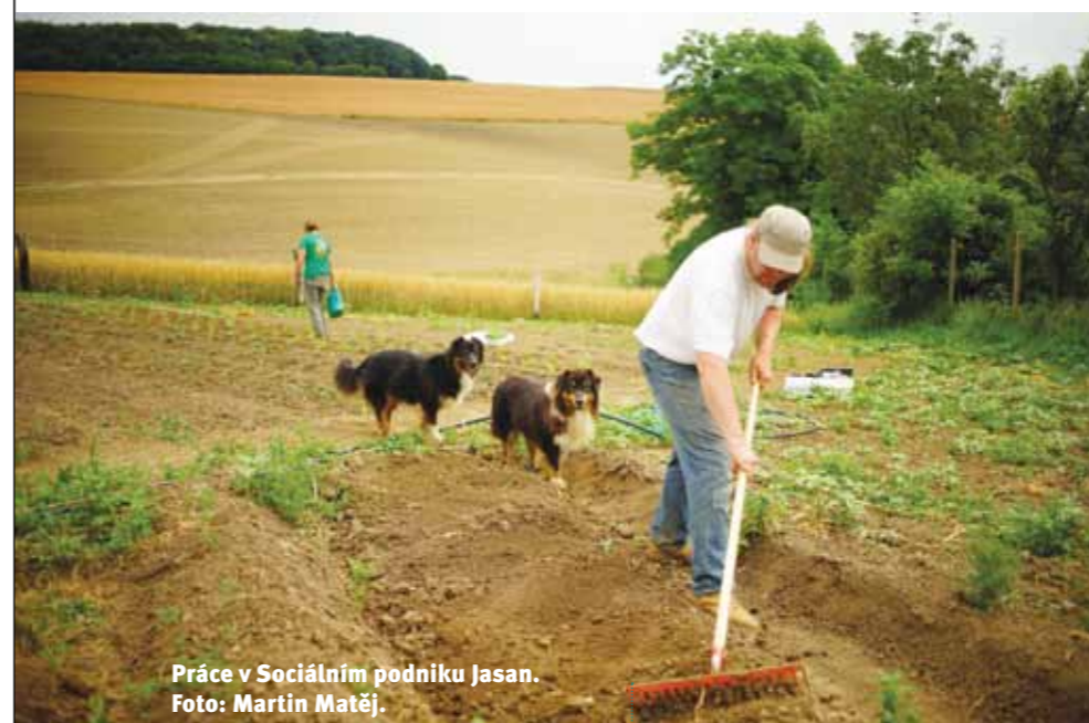
Práce v Sociálním podniku Jasan.

od waldorfského hnutí a filosofie Rudolfa Steinera, ale také propojuje zemědělskou produkci a využití zemědělského areálu i pro obyvatele ze znevýhodněním. To jde nakonec ruku v ruce s poznáním o prospěšnosti přirozeného a venkovního prostředí mimo formální zdravotnická a sociální zařízení. Podobně na irském venkově dokáží zužitkovat malá hospodářství pro sociální integraci osob, které by jinak za péči a aktivizaci musely dojíždět do daleko dostupných měst.