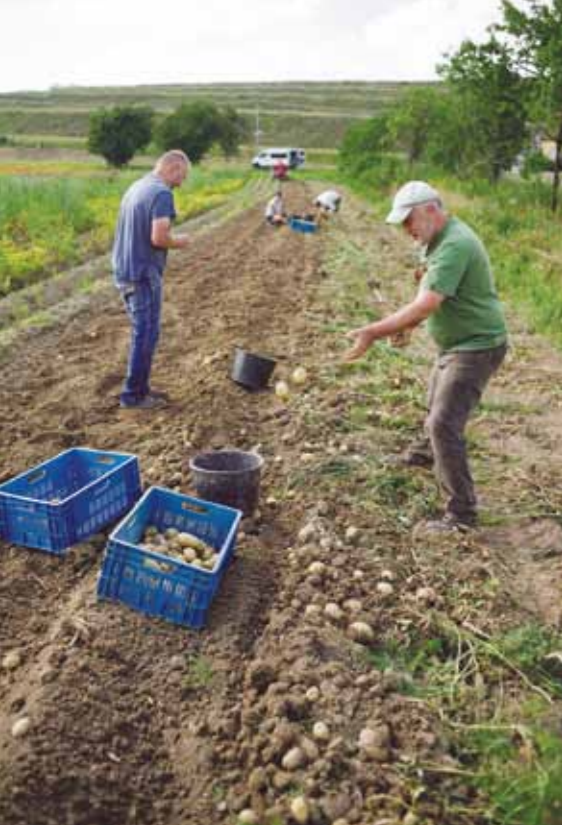
Jaro v Sociálním podniku Jasan.

z. s. v roce 2017, která vedle sdružování sociálních zemědělců a zastupování jejich zájmů, vydávání publikací a mezinárodního propojování, chce povzbudit právě k zakládání nových sociálních farem.