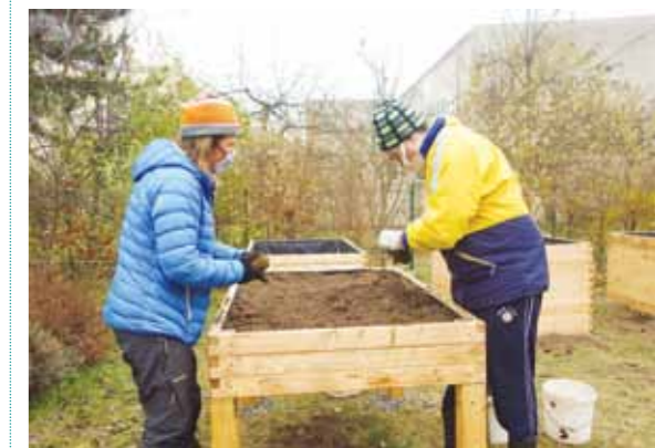
Sociálně terapeutická zahrada Diakonie ČCE Vrchlaby.

Systematicky se sociální zemědělství v ČR rozvíjí v posledních zhruba šesti letech. Ačkoliv již dříve existovala řada aktivit pod něj spadajících, jasnější formu sociálního zemědělství v ČR dostalo až s vytvořením Pracovní komise pro sociální zemědělství na Ministerstvu zemědělství České republiky a následně s představením Konceptu sociálního zemědělství v roce 2015. Spolu s rostoucím počtem farem a organizací hlásících se ke konceptu sociálního zemědělství vznikly i další součásti infrastruktury, o kterou se sociální zemědělství v ČR opírá. Sem můžeme zařadit vznik Tematické pracovní skupiny Sociální zemědělství – návrh systému opatření pro podmínky ČR, založené v rámci aktivit Celostátní sítě pro venkov RO SZIF Brno v roce 2017, či vznik zastřešující Asociace sociálního zemědělství,